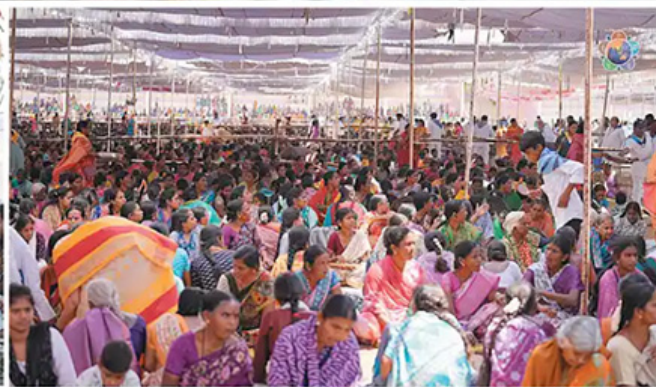
Devotees singing Sai Pancharatna Kritis