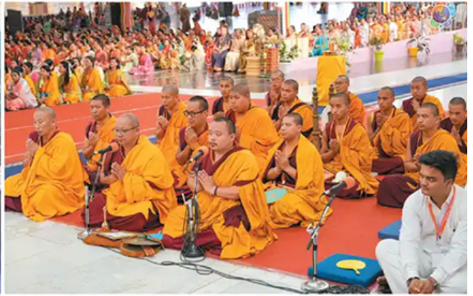
Buddha Purnima Celebrations (Report will be published in the next issue)